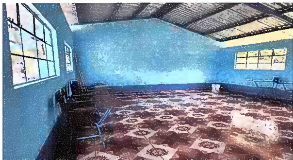
Foto1: MÓDULO 1. SUSTITUCIÓN DE PIZO CERÁMICO, ESTRUCTURAS METÁLICAS Y LAMINA