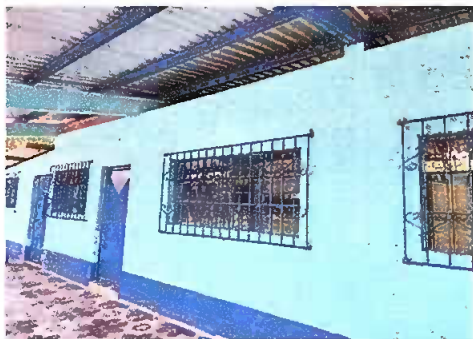
Foto 5: SUSTITUCIÓN DE BALCONES DE METAL, ESTRUCTURAS METÁLICAS DE TECHO.