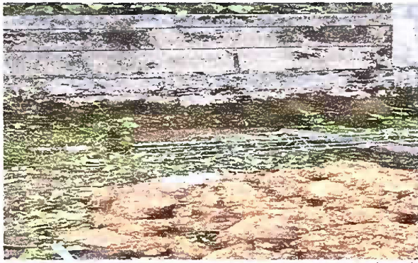
Foto1: REPARACIÓN DE PARED