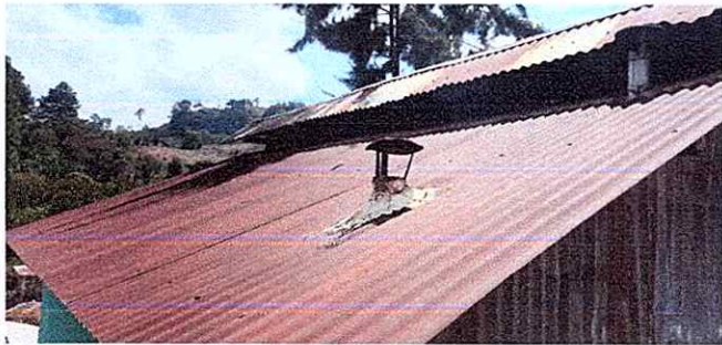
Foto1: Sustrucción de lámina, por lámina troquelada aluzinc calibre 26