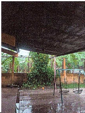
Foto1: modulo 2 mantenimiento a estructura de soporte de metal