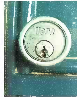
cambio de chapa a la direccion del establecimiento