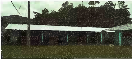
Vista de lejos del cambio a estructura metálica y lamina troquelada