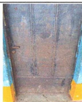
Foto 11: Mantenimiento de estructura de puerta, lijado y aplicación de pintura