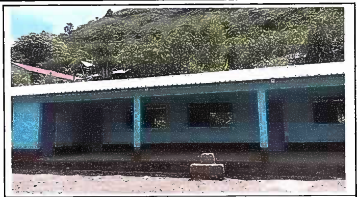
Foto1: Sustitución de lámina