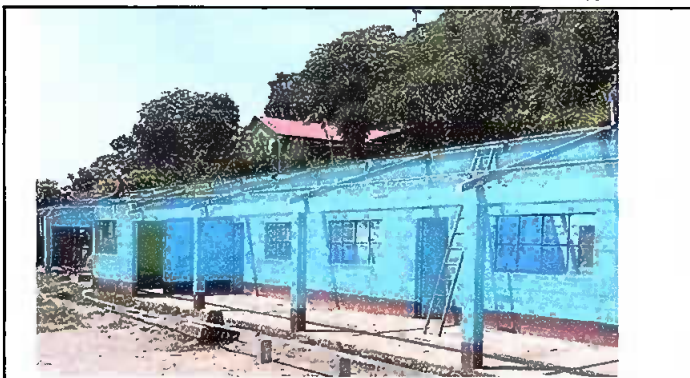
Foto1: Trabajos de Sustitución de lámina y estructura de soporte