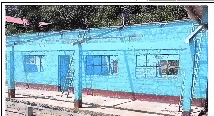
Foto 2: Trabajos de Sustitución de estructura de soporte y lámina.