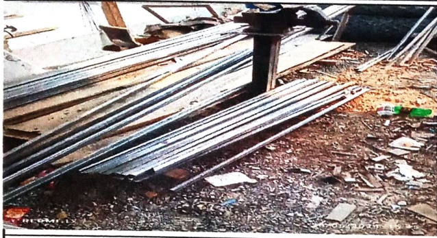
Foto1: Preparacion de tubo