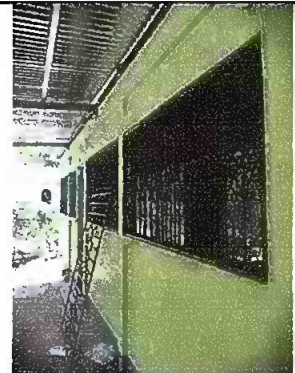
Foto2: sustitución de ventanas