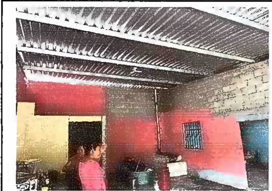
Foto1: Sustitución de lámina