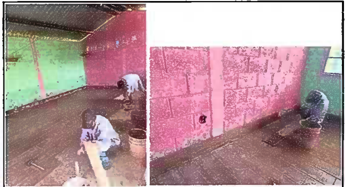
Foto 4. modulo 1. Sustitución de piso de torta de concreto por piso ceramico