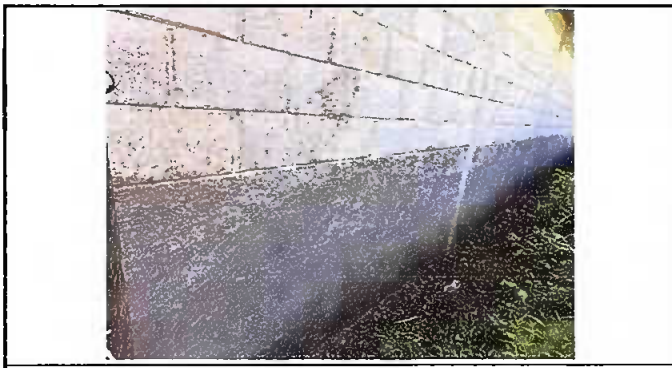
Foto 5. Modulo 1. Alisado en muro