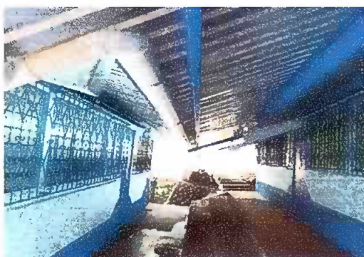
Foto 3: MODULO 1: Sustitución de bajada de agua pluvial de metal por tubo PVC 4"