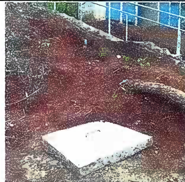
Foto 10: MODULO 3 SERVICIOS SANITARIOS: Reparación de tapaderas de caja.