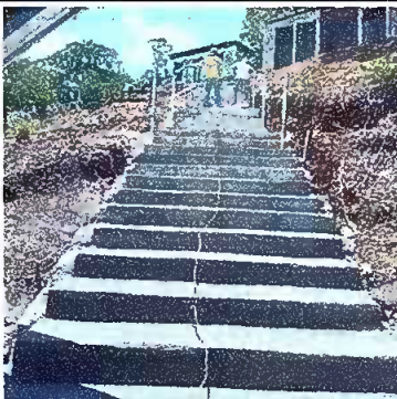
Foto 11: MODULO 3 SERVICIOS SANITARIOS: Sustitución de piso de torta de concreto