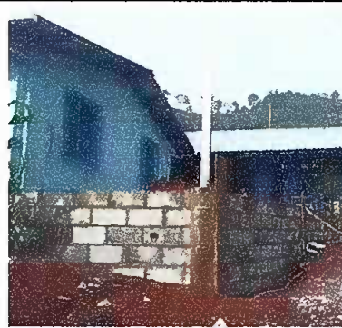
Foto 12: MODULO 4 REPARACIÓN DE MUROS DE CONTENCIÓN: Reparación de muro de contención

Observación: Si es necesario se pueden agregar hojas adicionales y actualizar el número de hojas.