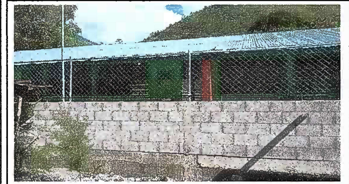
Foto 3 Reparación de muro perimetral de block con tubo hg , soleras intermedias y columnas