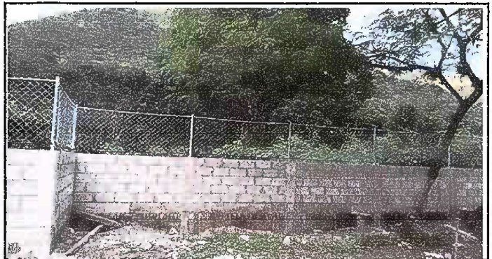
Foto 6 Reparación de muro perimetral de block con tubo hg , soleras intermedias y columnas

Observación: Si es necesario se pueden agregar hojas adicionales y actualizar el número de hojas.