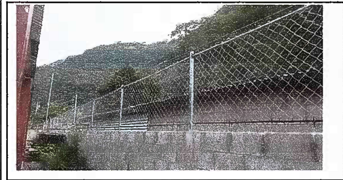
Foto 5 Reparación de muro perimetral de block con tubo hg , soleras intermedias y columnas