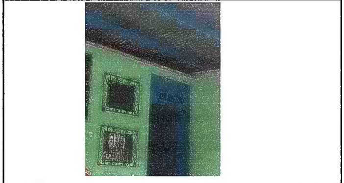
Foto 2 Módulo 1: Suministro e instalación de balcon de metal en ventanas