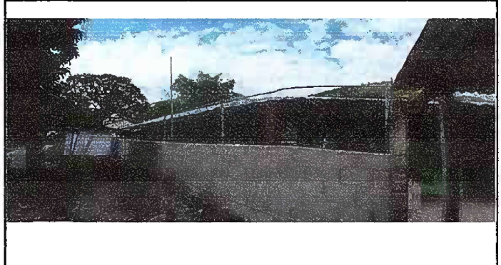
Foto 4 Reparación de muro perimetral de block con tubo hg , soleras intermedias y columnas