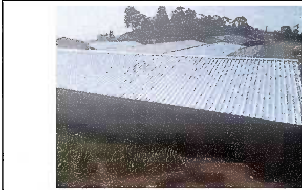
Foto 1: Sustrucción de lámina por lámina troquelada aluzinc cal 26