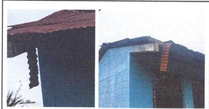
Foto1: sustitución de techo