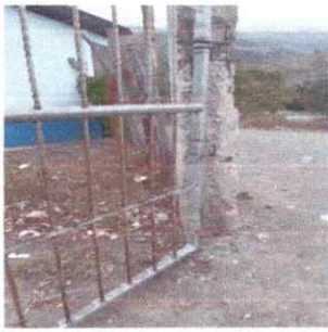
Foto 1: mejoramiento de portón de la entrada principal y la pared perimetral.