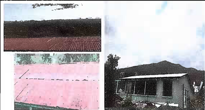
Foto1: Sustitucion de Laminas