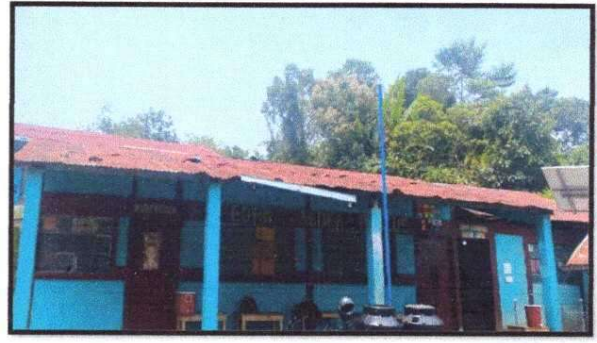
Foto 4: MÓDULO 1 Sustitución de capote de lámina para lámina troquelada