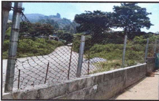
Foto 9: MURO PERIMETRAL Reparación de muro perimetral de blok con tuvo hg y malla galvanizada, soleras intermedias y columnas