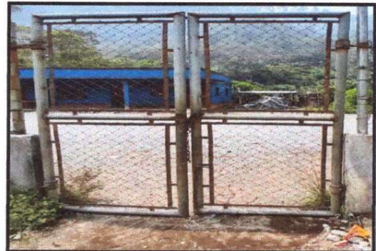
Foto 10: MURO PERIMETRAL Fabricación e instalación de porton de metal de ingreso