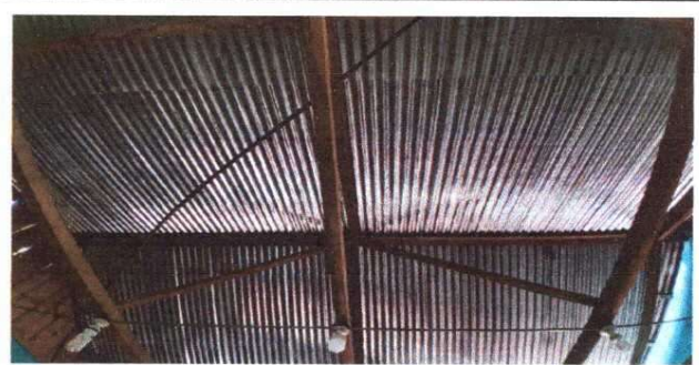
Foto 6: MÓDULO 1 Sustitución de estructura de soporte de madera, por metal

Observación: Si es necesario se pueden agregar hojas adicionales y actualizar el número de hojas.