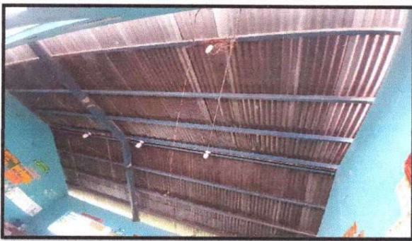
Foto 5: MÓDULO 1 Sustitución de elementos de fijación (tornillos)