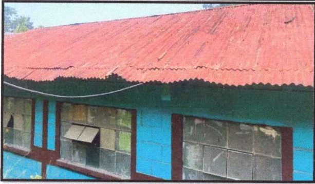
Foto 1: MÓDULO 1 Sustitución de lámina, por lámina troquelada aluzinc calibre 26