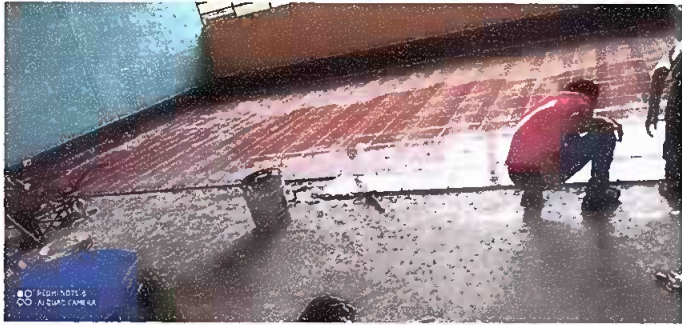
Foto1: Trabajos de Sustitución de piso en el aulas