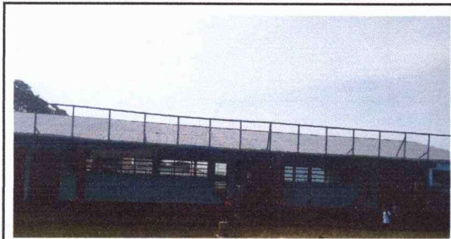
Foto1: módulo 1 sustitución de lámina por lámina troquelada