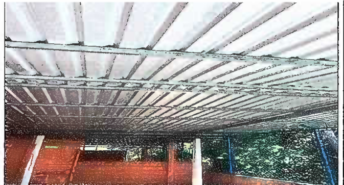
Foto 4: MODULO III: SUSTITUCIÓN DE ESTRUCTURA DE SOPORTE DE MADERA, POR METAL