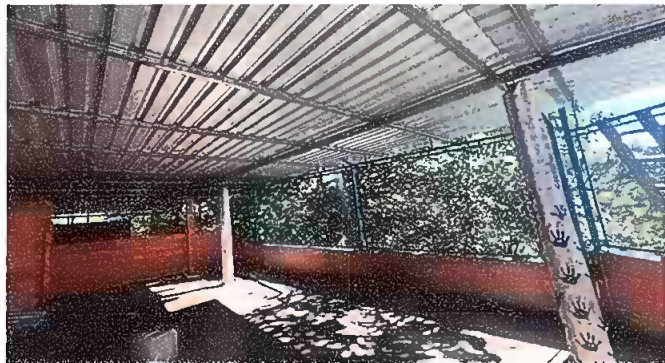
Foto 3: MODULO III: SUSTITUCIÓN DE LÁMINA, POR LÁMINA TROQUELADA ALUZINC CALIBRE 26