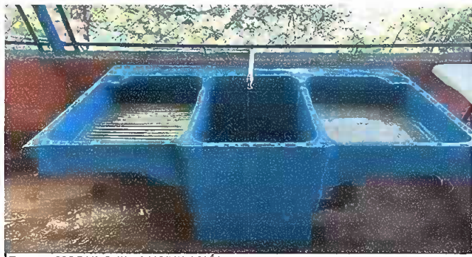
Foto 5: MODULO III: SUSTITUCIÓN DE PILA DE CEMENTO DE DOS LAVADEROS