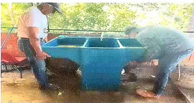
Foto 5: MODULO III: SUSTITUCIÓN DE PILA DE CEMENTO DE DOS LAVADEROS