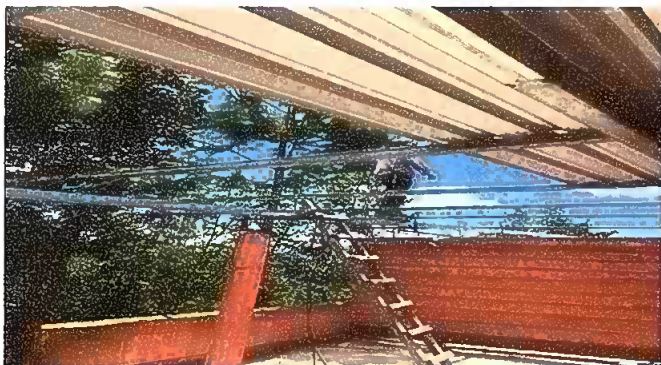
Foto 3: MODULO III: SUSTITUCIÓN DE LÁMINA, POR LÁMINA TROQUELADA ALUZINC CALIBRE 26