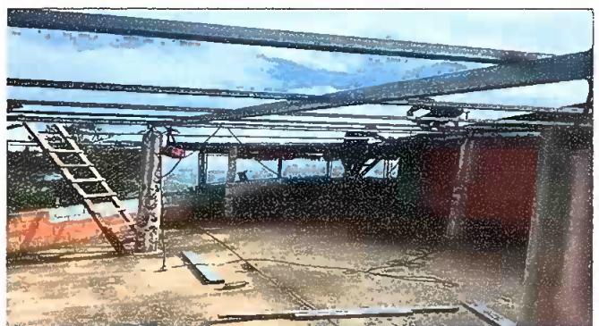
Foto 4: MODULO III: SUSTITUCIÓN DE ESTRUCTURA DE SOPORTE DE MADERA, POR METAL