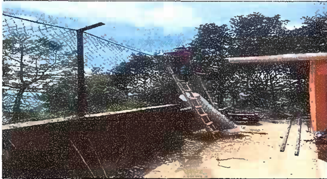
Foto 1: MODULO I: REPARACION DE MURO PERIMETRAL BLOCK CON TUBO HG Y MALLA GALVANIZADA, SOLERAS INTERMEDIAS Y COLUMNAS