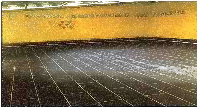
Foto 5: MÓDULO I. SUSTITUCIÓN DE PISO DE TORTA DE CONCRETO POR CERAMICO