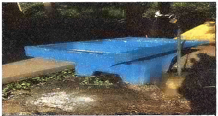
Foto 6: MÓDULO II. SUSTITUCIÓN DE PILA DE CEMENTO DE DOS LAVADEROS

Observación: Si es necesario se pueden agregar hojas adicionales y actualizar el número de hojas.