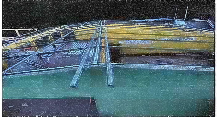
Foto 2: MÓDULO I. SUSTITUCIÓN DE ESTRUCTURA DE SOPORTE DE METAL, POR METAL