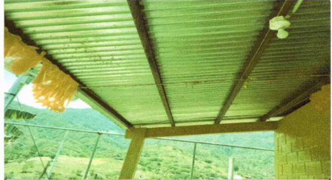
Foto 2:MODULO I. SUSTITUCION DE ESTRUCTURA DE SOPORTE DE MADERA, POR METAL