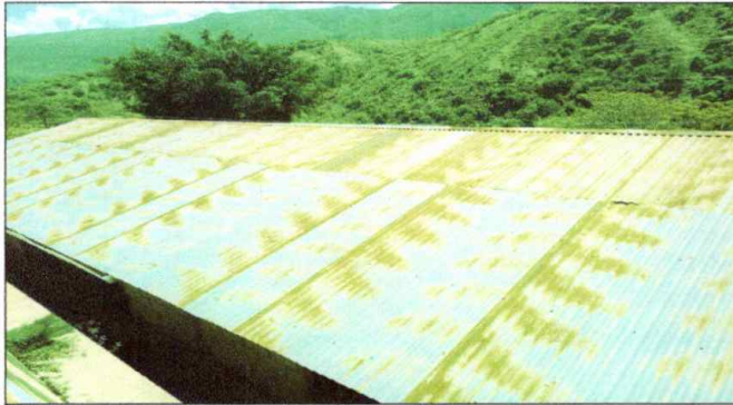
Foto 1: MODULO I. SUSTITUCIÓN DE LÁMINA, POR LÁMINA TROQUELADA ALUZINC CALIBRE 26