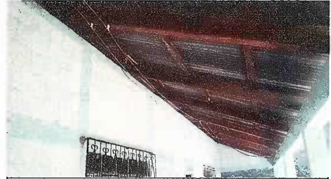
Foto 2: MODULO I. SUSTITUCIÓN DE ESTRUCTURA DE SOPORTE DE MADERA, POR METAL