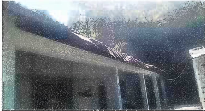
Foto 1: MODULO I. SUSTITUCIÓN DE LÁMINA, POR LÁMINA TROQUELADA ALUZINC CALIBRE 26