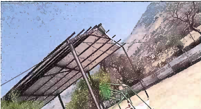
Foto 3: Módulo 2: Sustitución de lámina por lámina troquelada y sustitución de estructura portante de metal por metal.