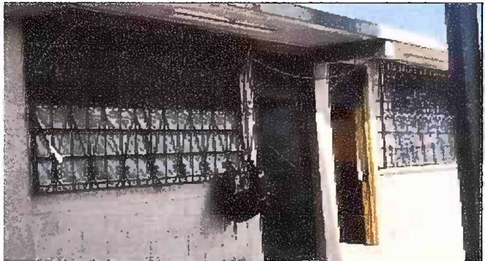
Foto 4: Módulo 3: Redforsar y hacer puertas de Rejas a la cosina y dirección