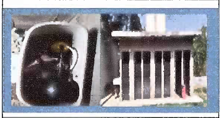
Foto 2: Módulo 4: Sustitución de accesorios de Inodoros Pintura en paredes interiores y exteriore