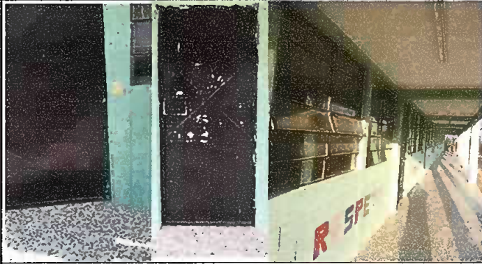
Foto 1: Módulo 1: Sustitución de chapas y Sustitución de estructura de soporte de puerta de metal y echa de Balcones de las Aulas y pintura general