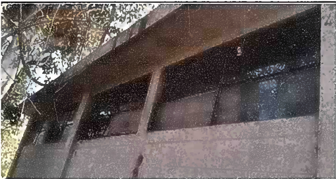
Foto 5: Módulo 3: hecer Balcones de la cosina y dirección y pintura general