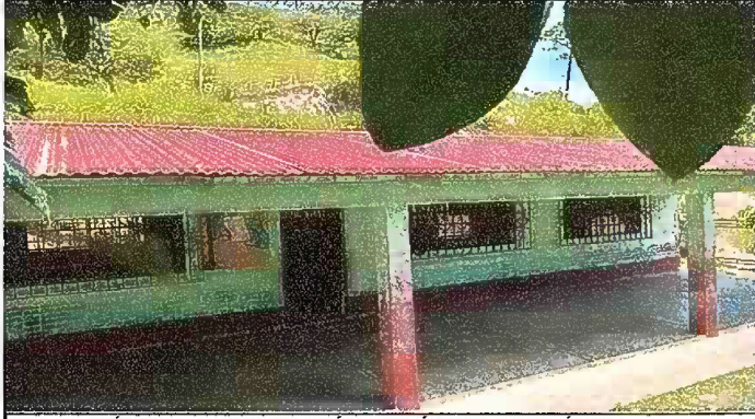
Foto 1: MÓDULO I. SUSTITUCIÓN DE LÁMINA, POR LÁMINA TROQUELADA ALUZINC CALIBRE 26