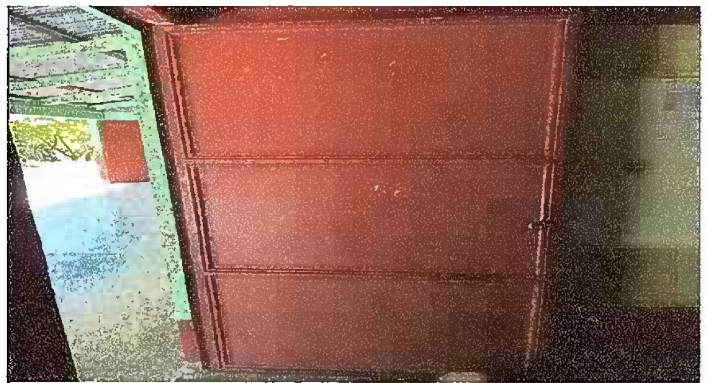
Foto 4: MÓDULO I. MANTENIMIENTO A ESTRUCTURA DE PUERTA (LIJADO, CEPILLADO, SUJECCIONES, APLICACIÓN DE PINTURA)