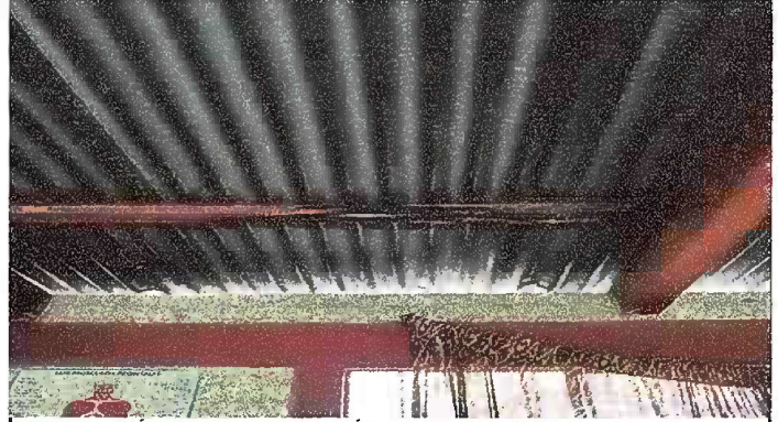
Foto 2: MÓDULO I. SUSTITUCIÓN DE ESTRUCTURA DE SOPORTE DE METAL, POR METAL