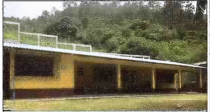
Módulo 1: Sustitución de lámina; por lámina troquelada Aluzinc calibre 26