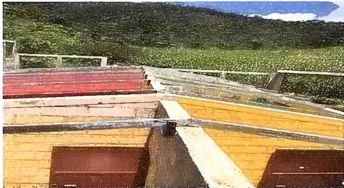
Módulo 1: Sustitución de estructura de soporte de madera, por metal.