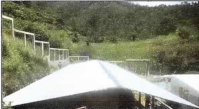
Módulo 1: Sustitución de lámina; por lámina troquelada Aluzinc calibre 26