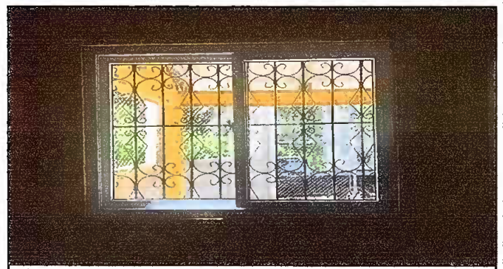
Módulo 1: Sustitución de ventanas de PVC

Observación: Si es necesario se pueden agregar hojas adicionales y actualizar el número de hojas.