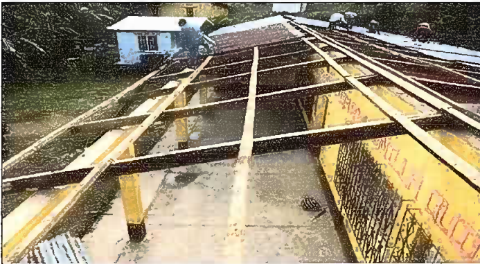
Módulo 1: Sustitución de lámina; por lámina troquelada Aluzinc calibre 26