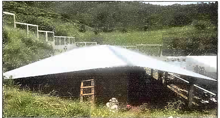
Módulo 1: Sustitución de lámina; por lámina troquelada Aluzinc calibre 26