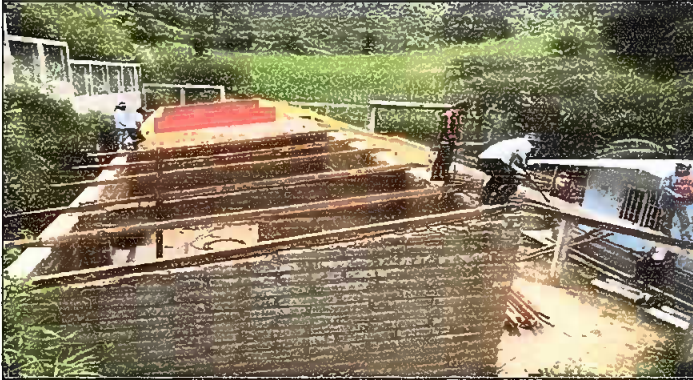
Módulo 1: Sustitución de estructura de soporte de madera, por metal.