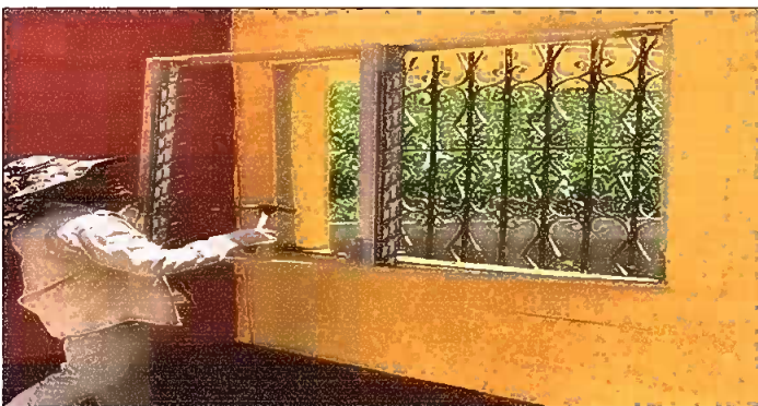
Módulo 1: Sustitución de ventanas de PVC