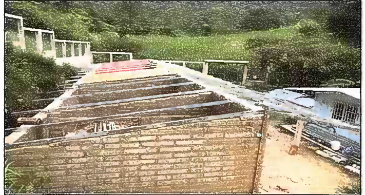
Módulo 1: Sustitución de estructura de soporte de madera, por metal.