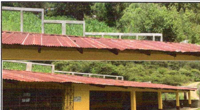
Módulo 1: Sustitución de lámina; por lámina troquelada Aluzinc calibre 26