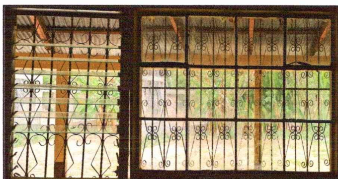
Módulo 1: Sustitución de ventanas de PVC

Observación: Si es necesario se pueden agregar hojas adicionales y actualizar el número de hojas.