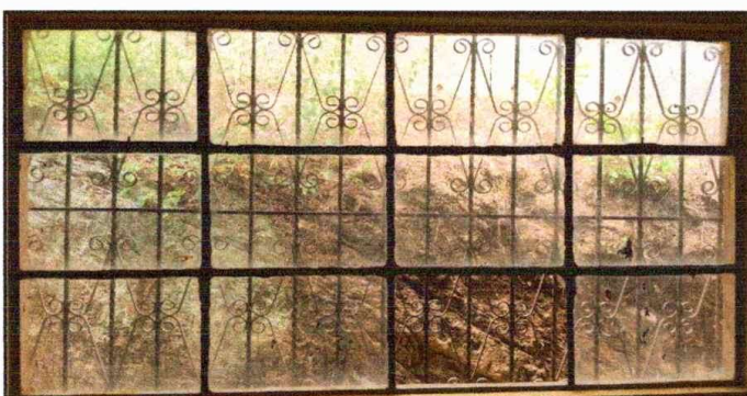
Módulo 1: Sustitución de ventanas de PVC