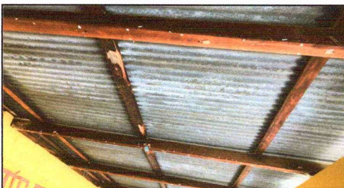
Módulo 1: Sustitución de estructura de soporte de madera, por metal.