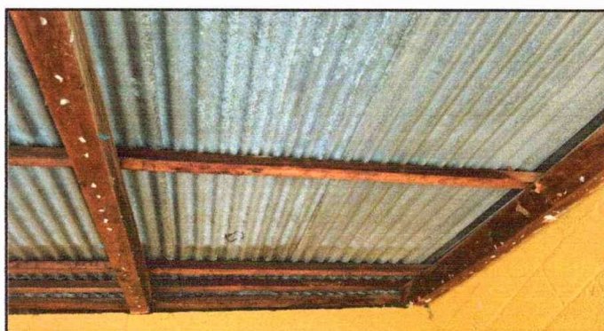
Módulo 1: Sustitución de estructura de soporte de madera, por metal.