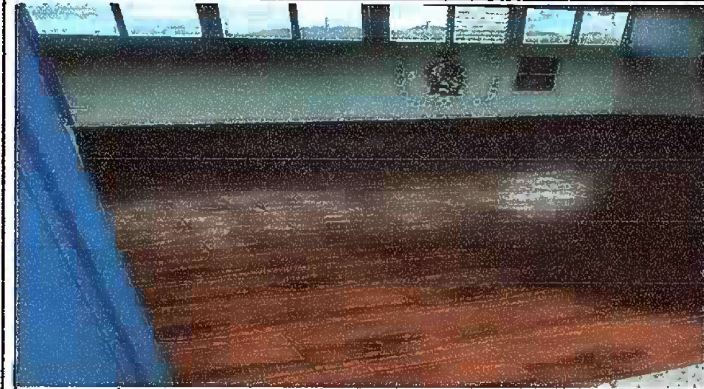
Foto 1: MÓDULO I. SUSTITUCIÓN DE PISO DE TORTA DE CONCRETO POR PISO CERAMICO