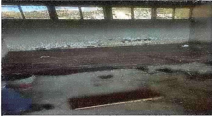
Foto 1: MÓDULO I. SUSTITUCIÓN DE PISO DE TORTA DE CONCRETO POR PISO CERAMICO