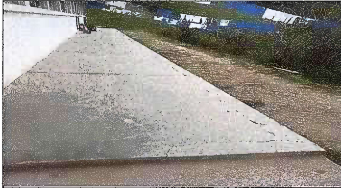
Foto 1: MÓDULO I. SUSTITUCIÓN DE PISO DE TORTA DE CONCRETO POR PISO CERAMICO