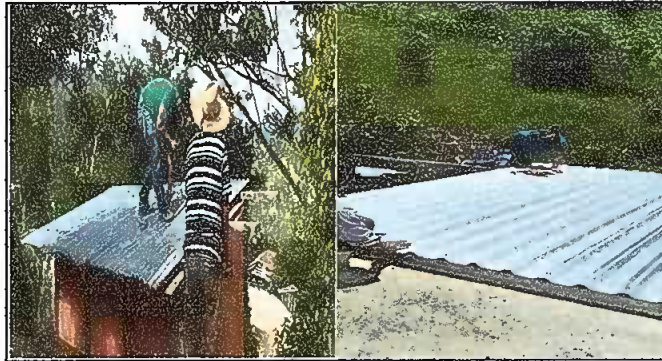
Foto 1: MODULO I: SUSTITUCIÓN DE LAMINA, POR LAMINA TROQUELADA ALUZINC CALIBRE 26