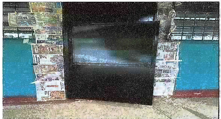
Foto 4: MÓDULO I. MANTENIMIENTO A ESTRUCTURA DE PUERTA (LIJADO, CEPILLADO, SUJECIONES, APLICACIÓN DE PINTURA)