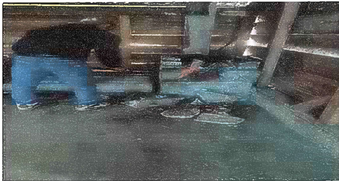
Foto 5: MÓDULO II. SUSTITUCIÓN DE PLANCHA DE METAL DE 3 HORNILLAS