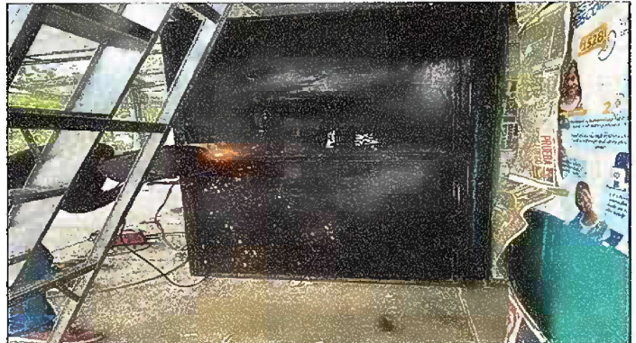
Foto 4: MÓDULO I. MANTENIMIENTO A ESTRUCTURA DE PUERTA (LIJADO, CEPILLADO, SUJECIONES, APLICACIÓN DE PINTURA)