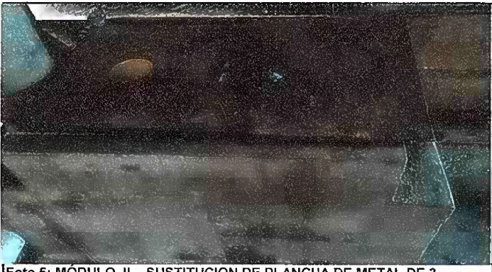
Foto 5: MÓDULO II. SUSTITUCION DE PLANCHA DE METAL DE 3 HORNILLAS