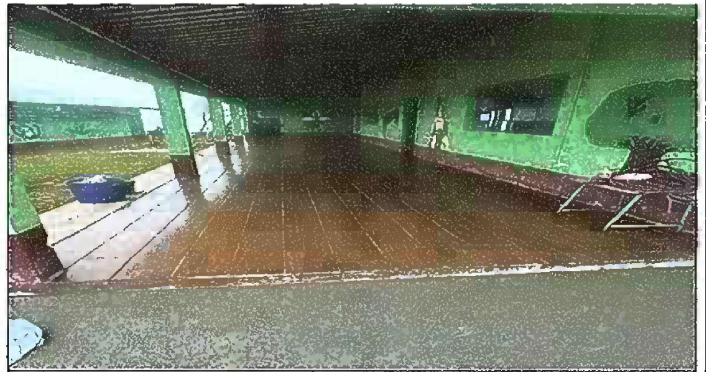
Foto 6: MÓDULO II. SUSTITUCIÓN DE PISO DE TORTA DE CONCRETO POR CERAMICO

Observación: Si es necesario se pueden agregar hojas adicionales y actualizar el número de hojas.