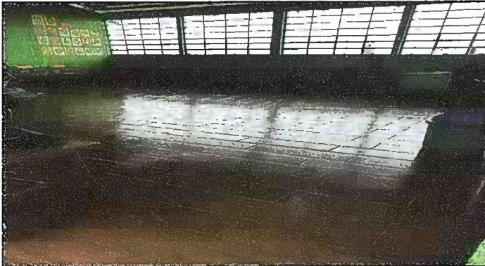
Foto 1: MÓDULO I. SUSTITUCIÓN DE PISO DE TORTA DE CONCRETO POR CEMENTO