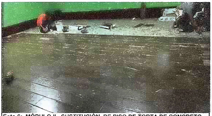
Foto 6: MÓDULO II. SUSTITUCIÓN DE PISO DE TORTA DE CONCRETO POR CERAMICO

Observación: Si es necesario se pueden agregar hojas adicionales, y actualizar el número de hojas.