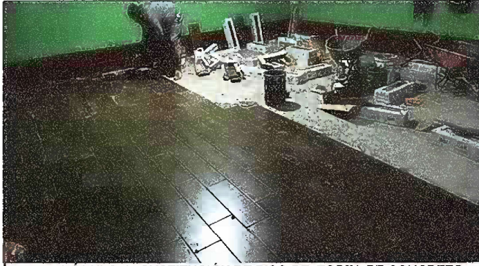
Foto 1: MÓDULO I. SUSTITUCIÓN DE PISO DE TORTA DE CONCRETO POR CEMENTO