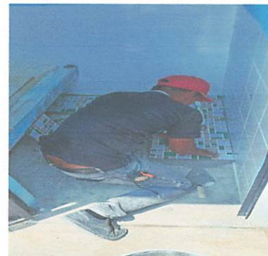
Foto 4: sustitución de piso de torta a piso ceramico antideslizante en los servicios sanitarios