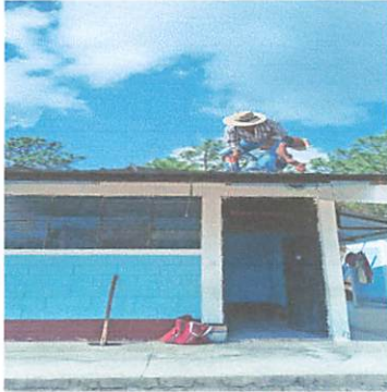
Foto1: Levantado de lamina antigua, para colocar la nueva lamina troquelada