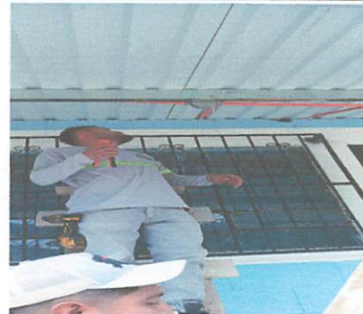
Foto 6: mejoramiento en la energia electrica: sustitucion de candelas blancas a luces led

Observación: Si es necesario se pueden agregar hojas adicionales y actualizar el número de hojas.