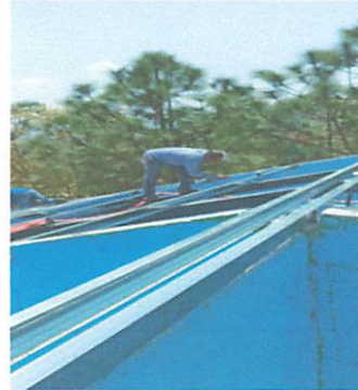
Foto 2: Colocacion del soporte de metal en la estructura del techo