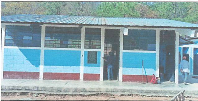
Foto 5: preparación para la sustitución del piso de torta a piso ceramico antideslizante en el corredor del aula y direccion