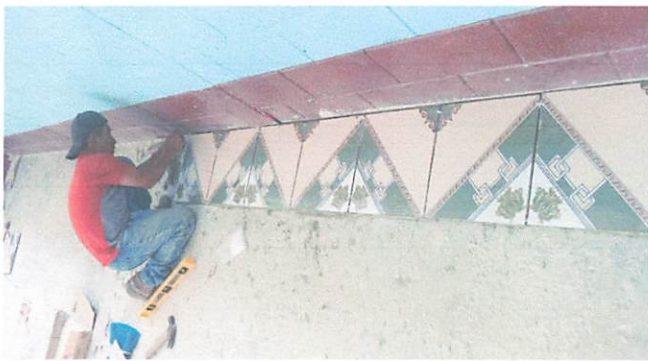
Foto 3: Sustitución de piso de torta a piso ceramico en el aula, bodega y direccion