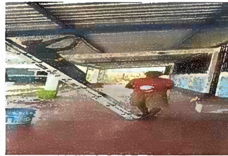
Foto 4: Sustitución de lámparas tipo LED, apagadores, tomacorrientes, y cableado