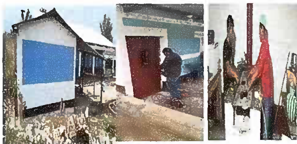
Foto 5: Sustitucion de banqueta alrededor de la cocina por filtracion de agua en la temporada de invierno, puerta y plancha.