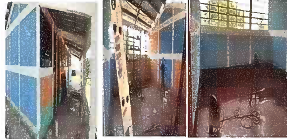
Foto 2: Sustitución de pintura en paredes exteriores e interiores