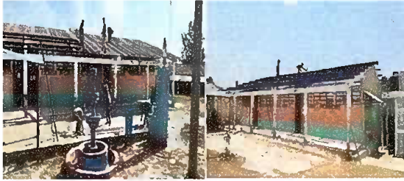
Foto1: Sustitución de laminas, por lámina troquelada aluzinc calibre 26