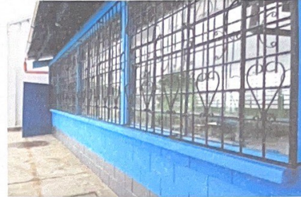
Foto 2: INSTALACION DE VIDRIOS EN MAL ESTADO Y BALCONERIA EN VENTANAS DE AULAS