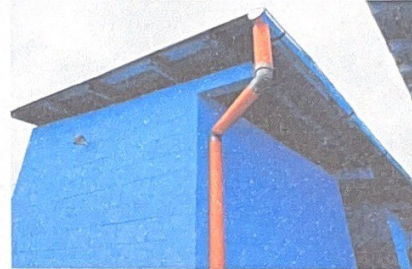
Foto 4: APLICACIÓN DE PINTURA EXTERIOR E INSTALACION DE CANALES EN TECHOS