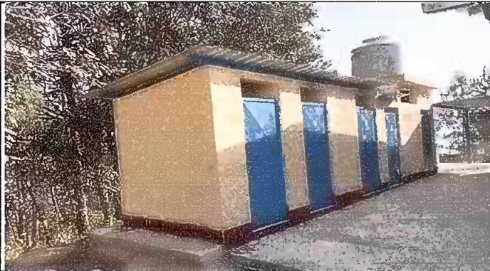
Foto1: sustitución de deposito de agua de 1100 litro por uno de 1700 litro