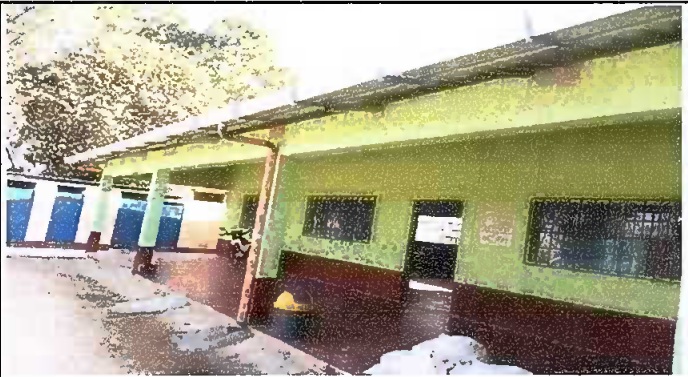
Foto3: Sustitución de capote de lámina para lámina troquelada