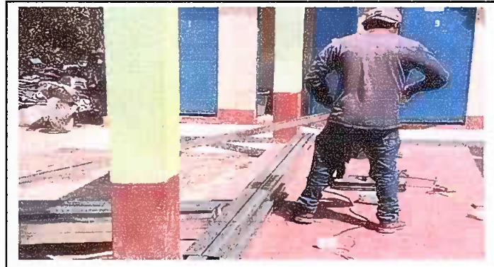
foto4: Sustitucion de estructura de soporte de madera, por metal y de elementos de fijacion