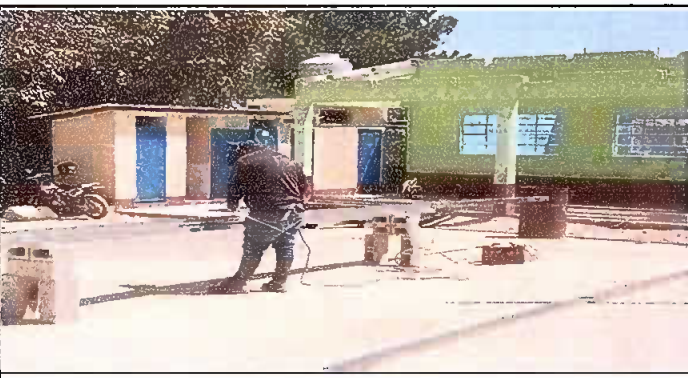
Foto 5: sustitucion de vidrios mas fabricacion e instalacion de balcon de metal