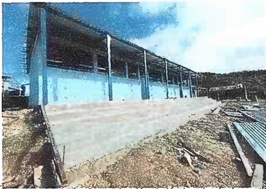
Foto 1: módulo 1 y 2: sustitución de lamina de aluzinc calibre 26