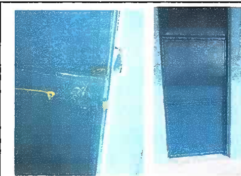
Foto 6: Módulo 1 y 2: cambio de chapas y mantenimiento de puertas

Observación: Si es necesario se pueden agregar hojas adicionales y actualizar el número de hojas.