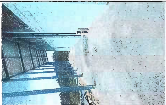
Foto 5: módulo 1 y 2: mantenimiento de planchas de concreto de patio