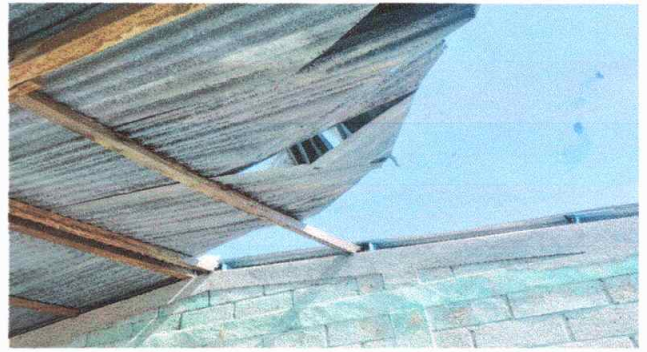
Foto 2: Modulo 1: sustitución de lámina por lámina de aluzinc calibre 26