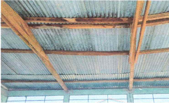
Foto1: modulo 1: sustitución de estructura portante de madera y sustitución de lámina de aluzinc calibre 26