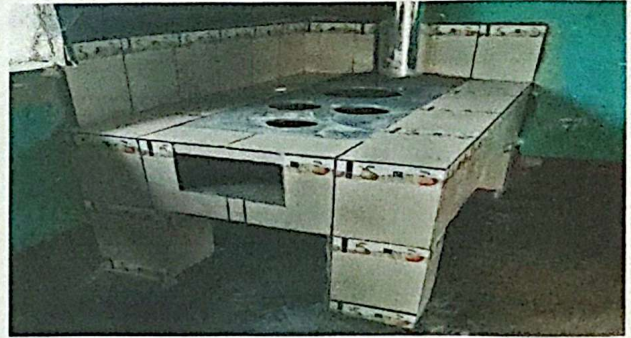
Foto 8 Módulo 4: Sustitución de estufa rural (completa) chimenea de concreto