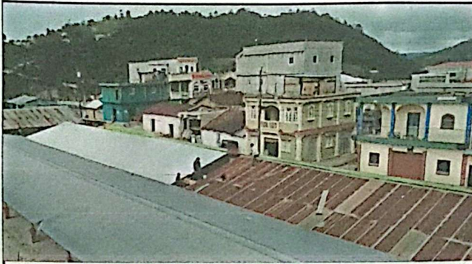
Foto1: Instalacion lamina troquelada calibre 26