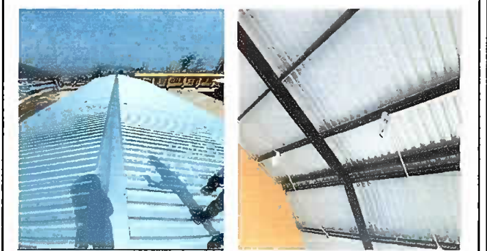
Foto 4: Lámina troquelada, lamparas tipo led, plafoneras y pintura en paredes interiores del módulo dos.