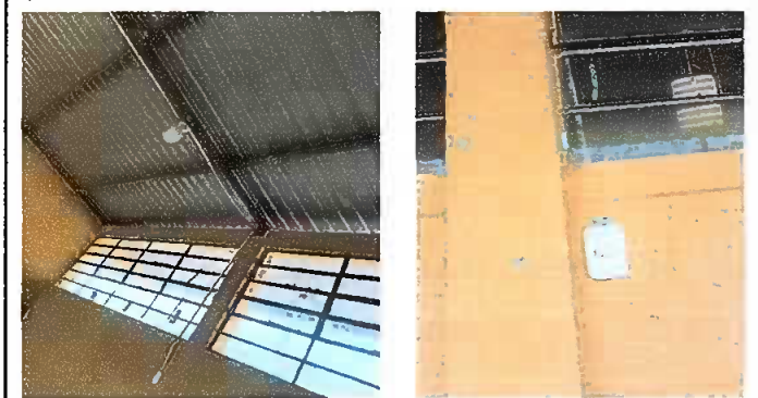
Foto 3: Cableado eléctrico, lámparas tipo led, plafoneras e interruptores del módulo uno.