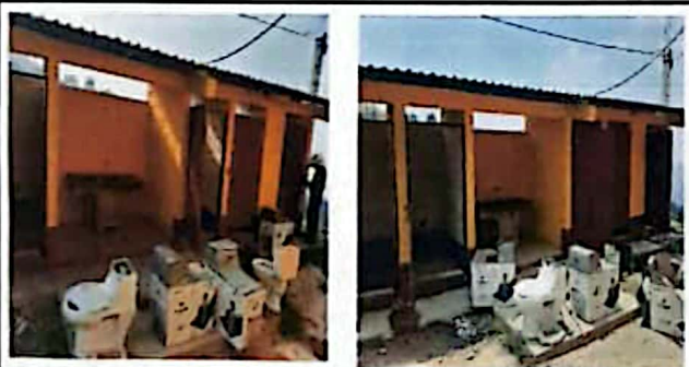
Módulo 3: Sustitución de inodoros y sustitución de lámina por lámina troquelada.