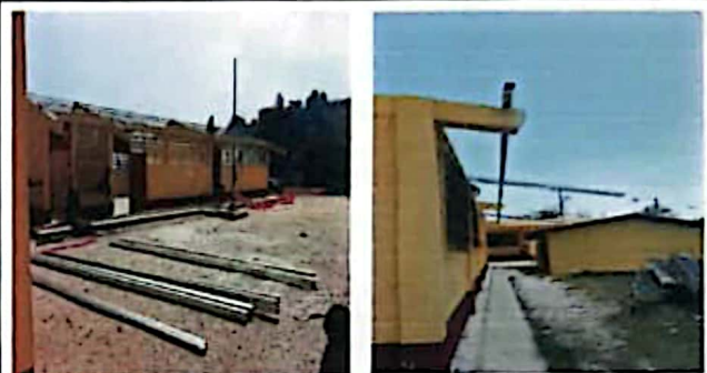
Módulo 1: Sustitución de estructura de soporte de metal, por metal.