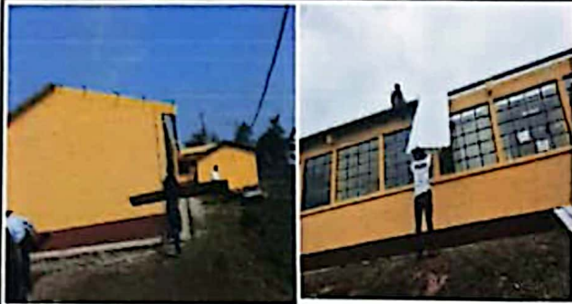
Módulo 1: Sustitución de lámina por lámina troquelada