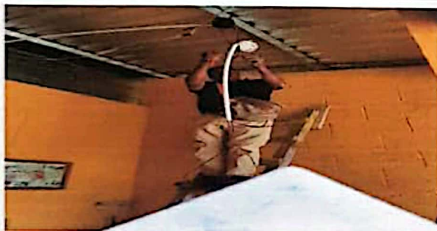
Módulo 1: Reparación de cableado eléctrico y sustitución de lámparas tipo LED, plafoneras e interruptores simples