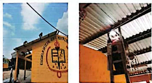
Módulo 2: Sustitución de lámparas tipo LED, plafoneras, sustitución de lámina por lámina troquelada y pintura en paredes interiores.