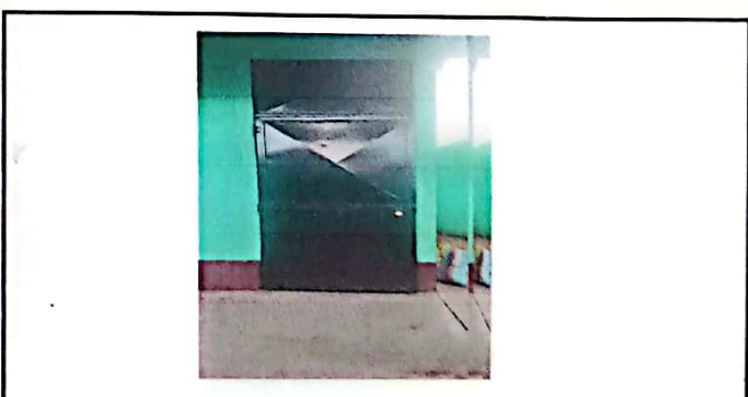
Foto 6: Reparación a estructura (lijado, cambio de tubo, cepillado, sujeción, aplicación de pintra y sustitución de unas puertas.

Observación: Si es necesario se pueden agregar hojas adicionales y actualizar el número de hojas.