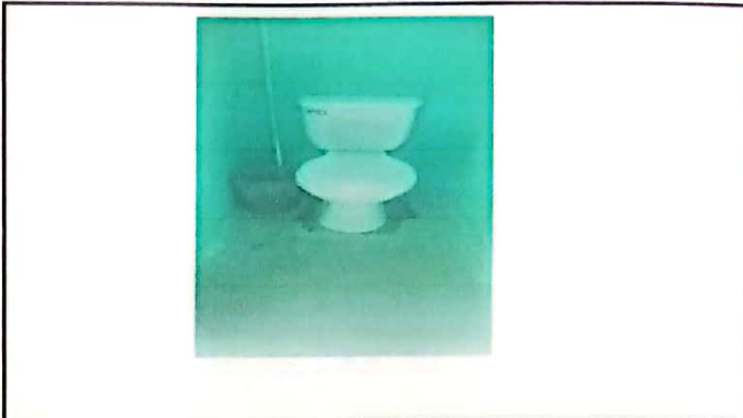
Foto 2: Instalación de inodoros, accesorios y tanques de los servicios sanitarios.