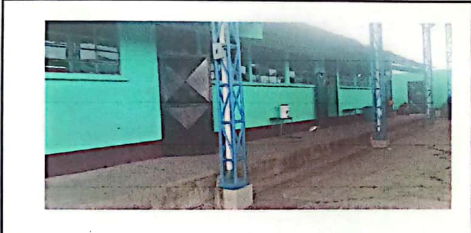
Foto 3: pintura en paredes interiores y exteriores de los tres módulos.